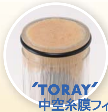
TORAY 中空糸膜フィルター

10μmガードフィルター+東レ製中空糸膜ろ過システムで原水を処理 汚れや細菌類をフィルターがカット