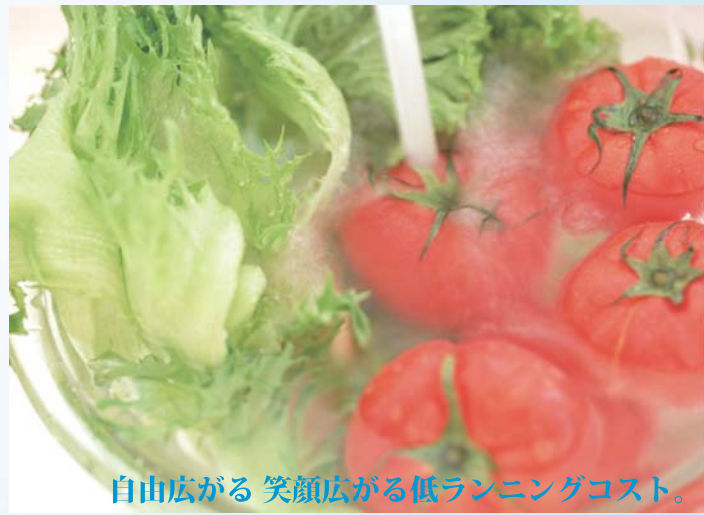
自由広がる 笑顔広がる低ランニングコスト。